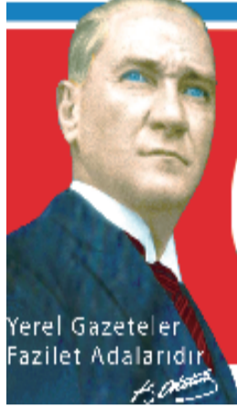
Yerel Gazeteler Fazilet Adalarıdır

Kepez Park Varsak Havuzu Aylık ücret tarifesi değişti. Plan ve Bütçe Komisyonu'nun raporu doğrultusunda yetişkin gündüz ücreti 650 TL, akşam ücreti 750 TL; çocuk ücreti hafta içi 400 TL, hafta sonu 500 TL; kulvar kiralama ücreti saati 600 TL oldu. Tayfun AKYATAN 6'da