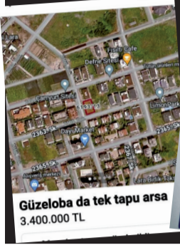
Güzeloba da tek tapu arsa 3.400.000 TL